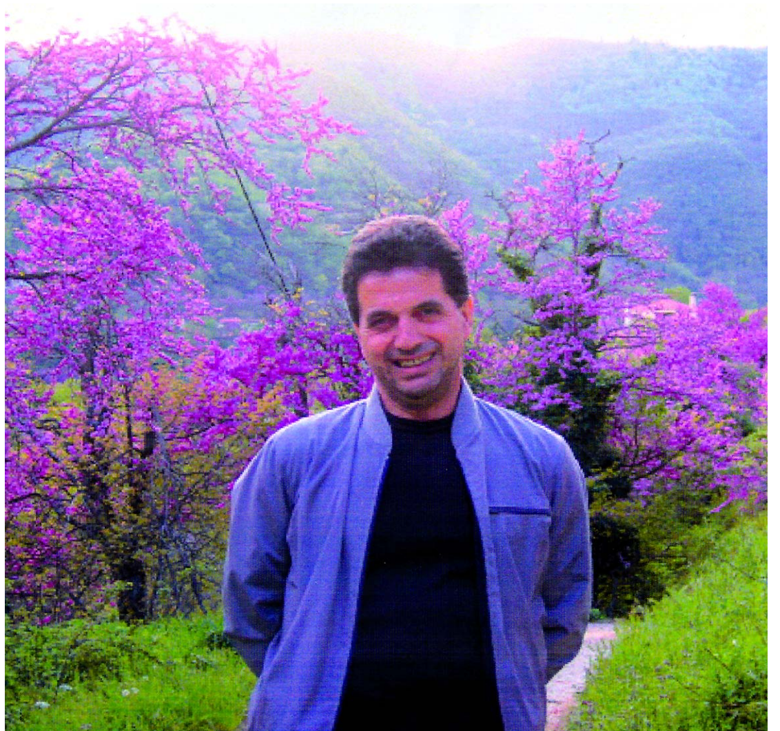
Απολαμβάνοντας την άνοιξη στο Ροβολιάρι με τις ανθισμένες κουσουπιές