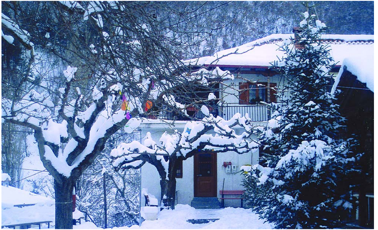
στην Πάτρα στις 30 - 11 - 2008.

Αρχιεπίσκοπος Αθηνών και πάσης Ελλάδος Ιερώνυμος κατά το κήρυγμά του στον ιερό ναό του Αγίου Ανδρέα