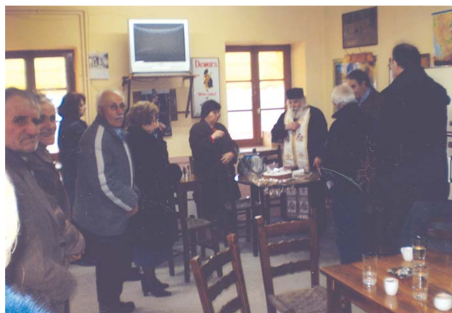
Από το κόψιμο της βασιλόπιτας στο χωριό

ΤΟ ΔΙΟΙΚΗΤΙΚΟ ΣΥΜΒΟΥΛΙΟ ΤΟΥ ΠΝΕΥΜΑΤΙΚΟΥ ΚΕΝΤΡΟΥ ΔΗΜΟΥ ΜΑΚΡΑΚΩΜΗΣ