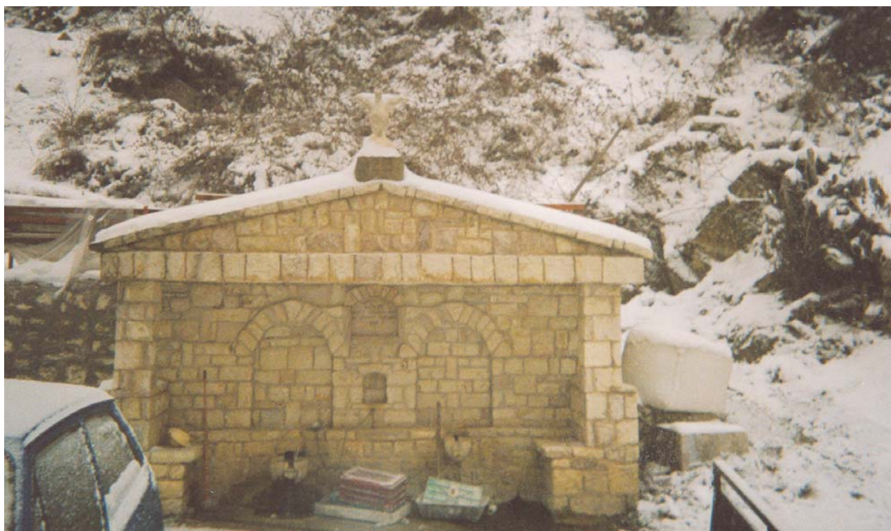
Χιόνι γύρω από τη θρύση στη συνοικία του Αγίου Γεωργίου. Και το νερό ξανάρθε!

Παρά τις δυσοίονες προβλέψεις ο χειμώνας που μας πέρασε υπήρξε αρκετά γενναιόδωρος σε βροχές και χιόνια. Όσοι παραμένουν ακόμη στις επάλξεις και διαβιούν στο χωριό είχαν την ευκαιρία να έχουν αρκετές μέρες με χιόνια. Και οι βροχές δεν πήγαν πίσω. Χόρτασε η γη νεράκι. Οι νερομάνες θέρειψαν. Οι στερεμένες βρύσες του χωριού μας προσφέρουν πλέον άφθονο και γάργαρο νερό. Όλα τα ρυάκια φούσκωσαν από τρεχούμενο νερό. Χρόνια είχαμε να ακούσουμε τον αχό της «κατεβασιάς» στο πέρα ρέμα. Και στα μεσοδιαστήματα το νερό που τρέχει είναι μπόλικο ! Σε όλα τα πρανή κατά μήκος του δρόμου απολαμβάνει κανείς το θέαμα του νερού που κυλά άλλοτε αργόσυρτα και άλλοτε με φόρα. Δείγμα της φροντίδας της φύσης που, ακολουθώντας τους προαιώνιους κύκλους της μας αποζημιώ-