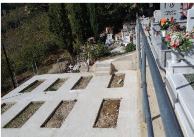
Από τα έργα ολοκλήρωσης ενός ακόμη επιπέδου στο κοιμητήριο του Αγίου Γεωργίου. Απομένει το τρίτο στο επάνω μέρος για αργότερα.