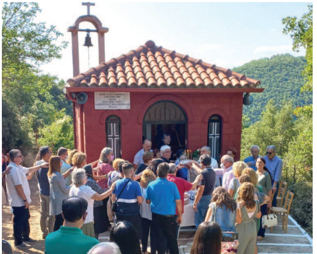
Από τη θεία λειτουργία που τελέστηκε την Κυριακή 7 Αυγούστου (από αθλεψία δεν μπόρεσε να προηγουμένως φύλλο) στο εκκλησάκι του Αγίου Σεραφείμ στη συνοικία του Αγίου Γεωργίου. Είχε προηγηθεί καθαρισμός του χώρου εσωτερικά και εξωτερικά με τη φροντίδα πολλών εκ των παρευρισκομένων που από σεμνότητα δεν θέλησαν να αναφερθούν τα ονόματά τους.

Ηλίας Σπυρόπουλος, ΛΑΜΙΑ (από τον «ΛΑΜΙΑΚΟ ΤΥΠΟ» 3/8/2022)