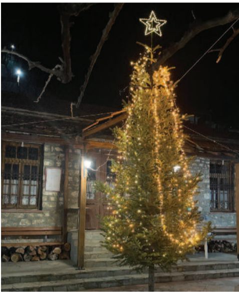
Το χριστουγεννιάτικο Δέντρο φωταγωγημένο στην πλατεία του χωριού

Παρά τις δυσκολίες και με σύμμαχο τον καλό καιρό βρέθηκαν στο χωριό για τα Χριστούγεννα αρκετοί από εμάς.