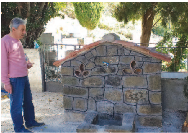
Τοποθέτηση μιας παραδοσιακής θρύσης στο προαύλιο του ναού και στην είσοδο προς το κοιμητήριο.