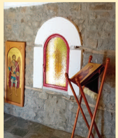
Το τρίποδο τοποθέτησης εικόνας είναι προσφορά του Δημήτρη Κων. Σακελλάρη.