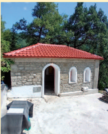
Η εξωτερική εικόνα του Ναού του Αγίου Χαράλαμπος.