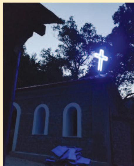
Ο φωτεινός Σταυρός αναμμένος.