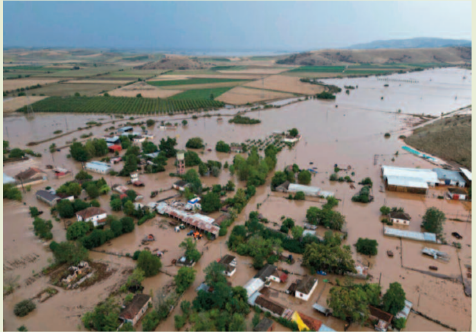
Από την πυρκαγιά δίπλα στη Μακρακώμη και η Θεσσαλία πλημμυρισμένη.

Αποφύγαμε τη φωτιά δίπλα μας χάρη στην έγκαιρη επέμβαση των πυροσβεστικών δυνάμεων και μέσων.