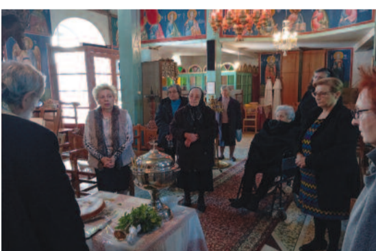
Δύο εικόνες του χωριού τον μήνα Δεκέμβριο, λίγο πριν τα Χριστούγεννα και από τον αγιασμό των υδάτων

Παρά τις ευκολίες και βολές που έχουν πια τα σπίτια μας, δεν άναψαν πολλά τζάκια κατά τις ημέρες των Χριστούγεννων και ευλογηθήκαμε μόνο την Κυριακή πριν τα Χριστούγεννα και την παραμονή των Φώτων .