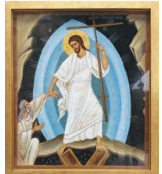
Είθε η Ανάσταση του Κυρίου να φέρει και ανάσταση στις καρδιές όλων μας. Το Διοικητικό Συμβούλιο του Συλλόγου

Ακολουθούν φωτογραφίες από την Ακολουθία και την περιφορά του Επιταφίου.