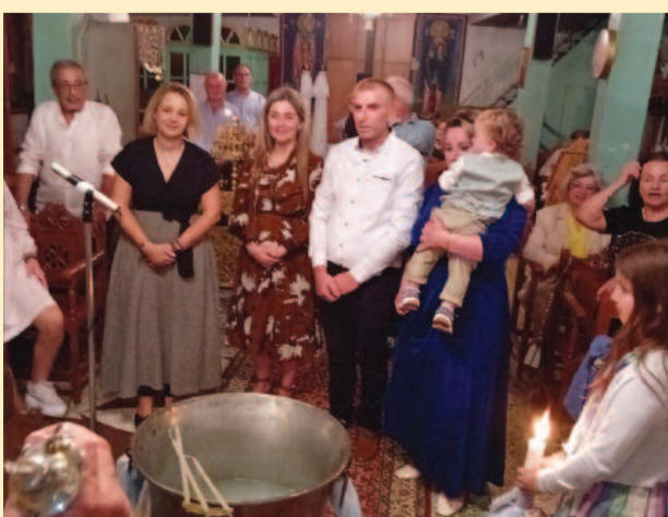
Στο τέλος, η οικογενειακή φωτογραφία: ο νεοφώτιστος με νονές και γονείς.