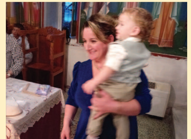
Ο νεοφώτιστος ντυμένος με τα βαπτιστικά του στην αγκαλιά της Μαρίας του.