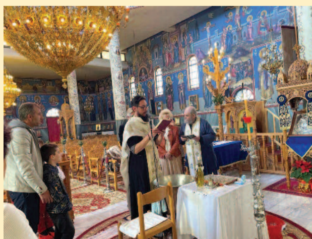
Η προετοιμασία του μεγαλύτερου.