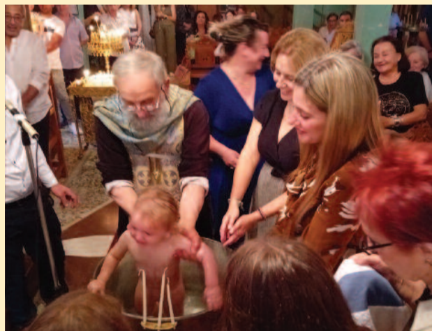
«Βαπτίζεται ο δούλος του Θεού Μάρκος» ξαφνιασμένος και ήρεμα διαμαρτυρόμενος.