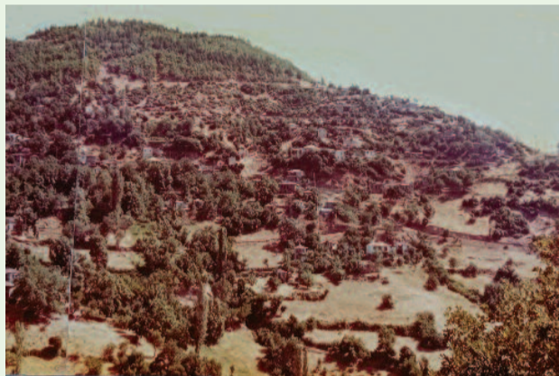
Οι φωτογραφίες της συνοικίας του Αγίου Γεωργίου από το αρχείο της Ζωής Γερογιάννη-Πλωμαρίτη από τη δεκαετία του 1960 μας βοηθούν να συγκρίνουμε το ΤΟΤΕ με το ΤΩΡΑ.

Επίσης υπήρχαν κήποι στα Πλασταρέικα που ποτίζονταν από τη Μότσιω. Κήποι υπήρχαν στο Λουμπαρδά, στα Καστριά, στου Κουτή τα κλήματα, στα Κοσιάριστα, στη Φτελιά και σε άλλους χώρους γύρω από το χωριό, όπου υπήρχαν μικροπηγές: Παρασπόρια, Μάρω, Παναγιά και άλλες περιοχές.