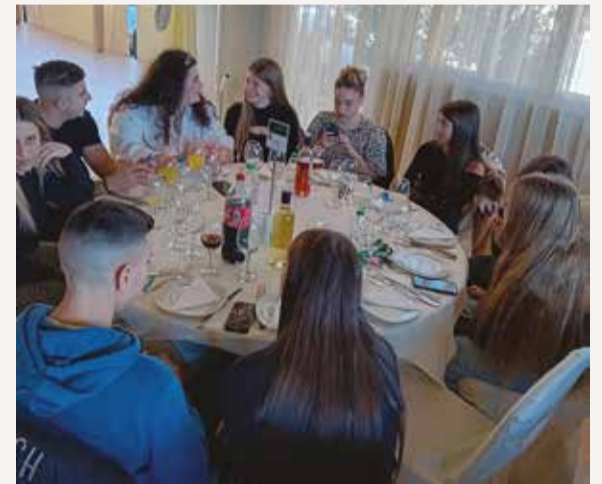
Οι διάφορες παρέες στα τραπέζια.