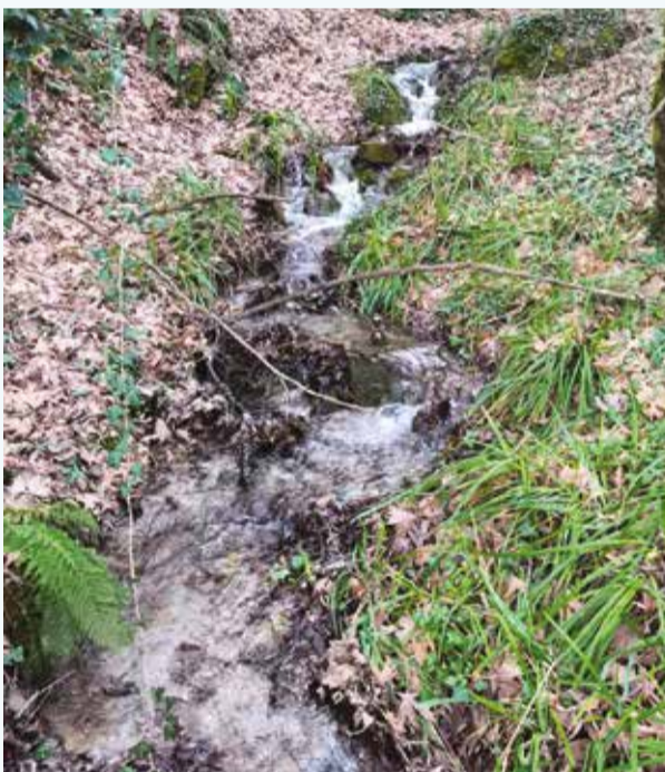
Νεράκι της φύσης δίπλα στην παιδική χαρά.

Τα μεσοδιαστήματα χωρίς βροχή μεγαλώνουν αυξάνοντας τη συχνότητα και τη διάρκεια των ξηρασιών και της λειψυδρίας. Έτσι προκύπτει ταχύτερη εξάντληση ων υπόγειων υδροφορέων και συνύπαρξη πλημμυρών και ανομβρίας.